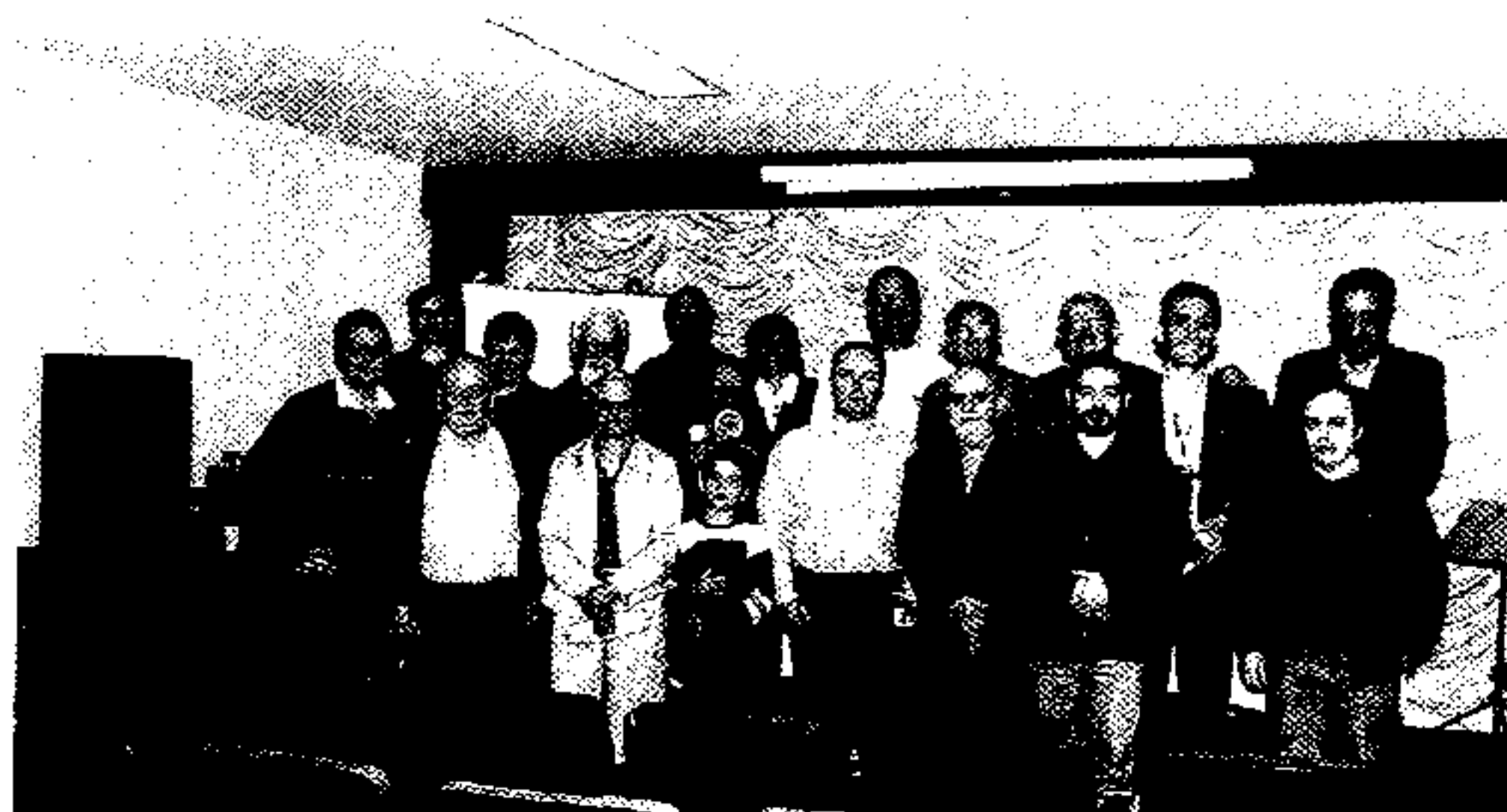
Associados e convidados após a Assembléia Geral do CXEB de 25/07/99