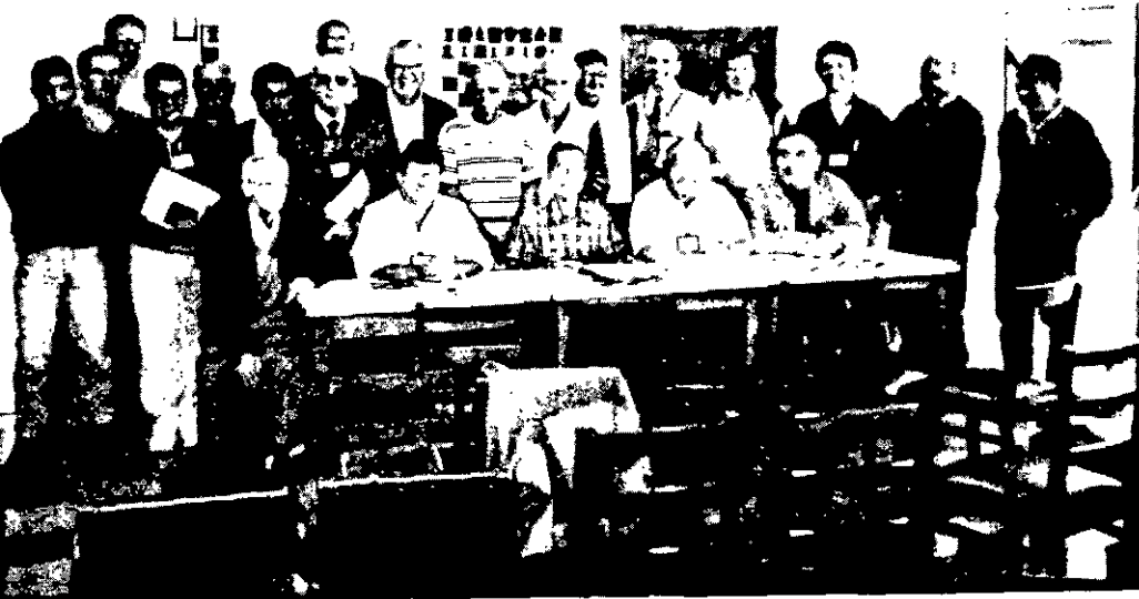
Associados na Assembléia Geral de 23.07.95