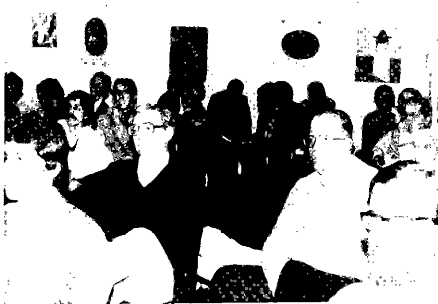
Flashes da Assembléia

Mas o bom mesmo, seria que o associado que pretende abandonar o torneio ou os torneios que disputa, pensasse nos companheiros que compõem o grupo ou grupos a que pertencem! Gastos desnecessários, tempo perdido, desilusões!