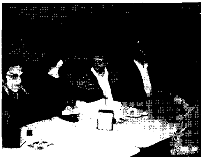
Lanche da diretoria

Deste modo, a partir de janeiro de 1982, abandonar um torneio significa uma multa correspondente a meia anuidade, por cada grupo abandonado. Isto sem dúvida servirá de freio àqueles que costumam inscrever-se em vários torneios simultaneamente, sem examinar se têm condições de levá-los até o fim.