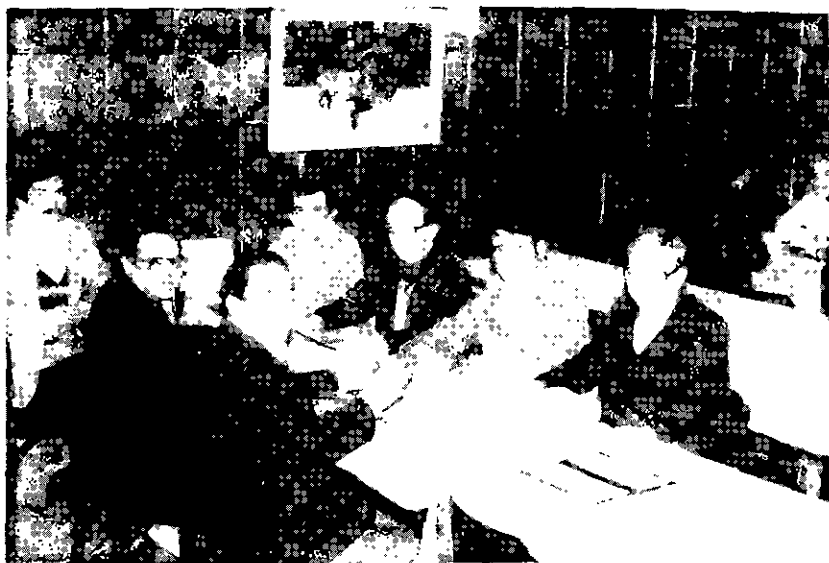
Encontro final – bota-fora do presidente

Mas muita coisa foi discutida e mencionada, sugestões para o melhoramento do CXEB, que serão analisadas pela Diretoria, no âmbito de suas atribuições estatutárias.