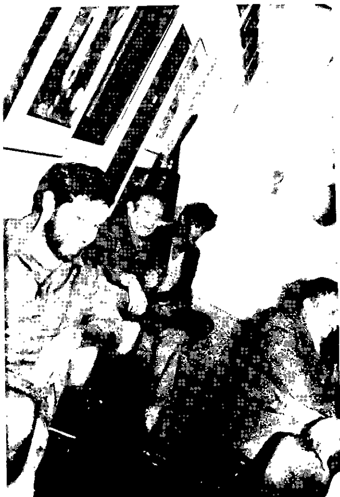
Fiaches da Assembléia

Em termos práticos: a partir de janeiro, todos os abandonos serão levados ao conhecimento do Tesoureiro, que distribuirá entre os diretores encarregados de tomar inscrições de torneios, lista dos devedores por torneios abandonados. Novas inscrições só serão aceitas após a comprovação de que as multas foram pagas.