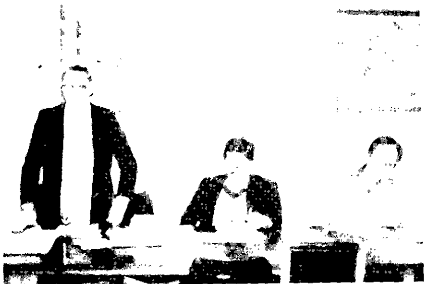
Flashes da Assembléia

Outro assunto debatido na reunião da Diretoria foi o problema dos Torneios de Acesso à Categoria Especial.