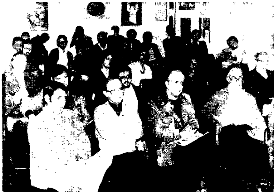
Flashes da Assembléia

Alguns problemas levantados já tinham tido solução: — TEs, abandonos. Outros ficaram ainda em estudo, porque dependentes de pareceres técnicos: rating, atualização de regulamentos, etc. Logo a seguir publicamos a ata da reunião, que resume o que foi discutido e aprovado.