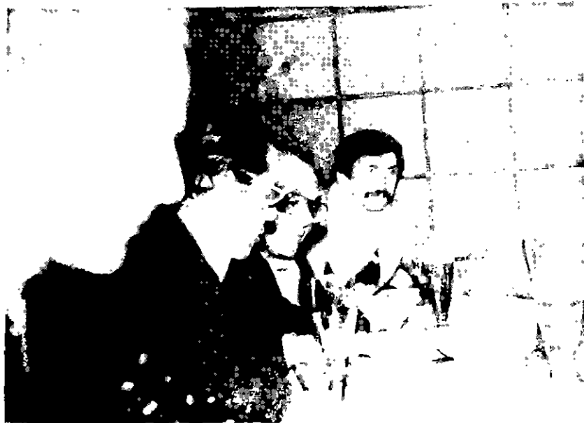
Encontro final — bota-fora do presidente

Estamos divulgando fotografias tomadas por nossos "repórteres", que cobrem as seguintes etapas: reunião de diretoria, hora do lanche da diretoria, momentos informais de preparação para a Assembléia, Assembléia propriamente dita, e encontro pós-reunião final, com o presidente aquecendo as turbinas para voltar à Bahia, no dia seguinte.