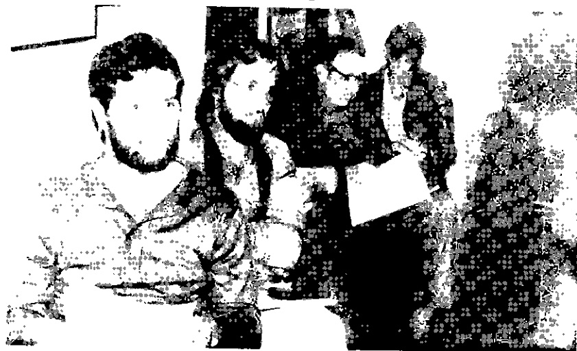
Flashes da Assembléia

Claro, o ideal seria que cada associado pensasse no CXEB, como um todo, antes de consumir um abandono. O lógico seria que ele pensasse no tempo perdido do diretor que fez o emparceiramento, do diretor que providenciou a confecção e remessa dos papéis indispensáveis ao início do torneio, do diretor encarregado do setor a que pertence o seu torneio; que pensasse nos gastos do CXEB, desde o seu pedido de inscrição, — carta comunicando a efetivação da inscrição, remessa de material (custo dos impressos e despesas postais), nos gastos das correspondências registradas que o CXEB é obrigado a fazer, procurando localizar um faltoso que simplesmente se desinteressou por um torneio que não tem chance de ganhar.