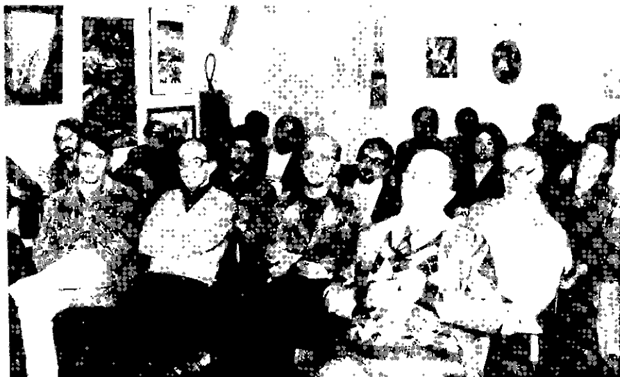
Flashes da Assembléia

Por outro lado, ficou prevalecendo o direito da diretoria de suspender o faltoso, caso este continue na prática de abandonar competições, simplesmente porque tem condições financeiras de pagar as multas agora regulamentadas.