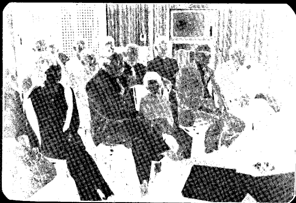
Aspecto da Assembléia.